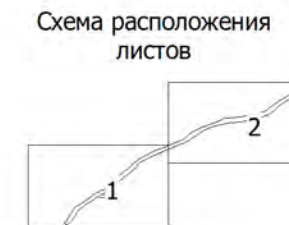
Перечень координат характерных точек границ зон планируемого размещения линейных объектов смотри в Книга 1. Основная часть проекта планировки территории